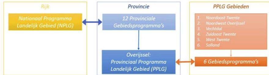
Schematische samenhang NPLG – PPLG – GGA gebiedsprogramma's